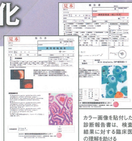
カラー画像を貼付した診断報告書は、検査結果に対する臨床医の理解を助ける

秋田県では、常勤病理医を抱える医療機関は少なく、病理診断は県外の検査機関に委託する 경우가ほとんど。開設当初、その多くが仙台や東京の大手検査機関に外注されていたという。